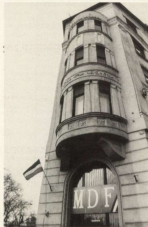
Bartók Béla út 61.

A vita előtt ismét Közakarati néni ragadja el a mikrofont: „Tegnap nagyon boldog voltam, a televízióban láttam a Feketen-fehéren című műsort, amelyben az egyesületünkről beszéltek. De nem az az érdekes, hogy beszéltek, talán azt is mondhatom, tartanak tőlünk...” No lám, itt az első eredmény! Eljött az ideje, hogy szóhoz jusson a köz és elmondja akaratát. Most Közakarati bácsi kérdez. Mérföldesben, mintha láva akarna kitörni belőle, de nem találja, hogy melyik nyílason. „A nemzetközi sajtó irányvonala mindenki előtt ismert. Arra volnék kíváncsi, hogy mennyi