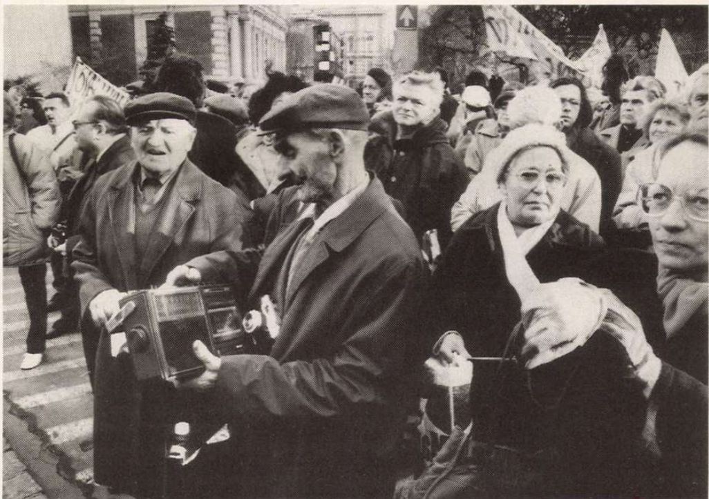
Hívd a rádiót!